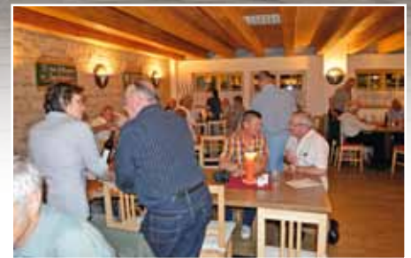
Heurigenbesuch beim Weingut Klaus

Anschließend ging unsere Fahrt weiter nach Wolkersdorf, wo wir zur letzten Station unseres Ausfluges – einem Heurigenbesuch beim Weingut KLAUS – kamen. Wir wurden sehr freundlich empfangen und die vorbestellten Speisen warteten schon auf die Kollegenschaft. Je länger der