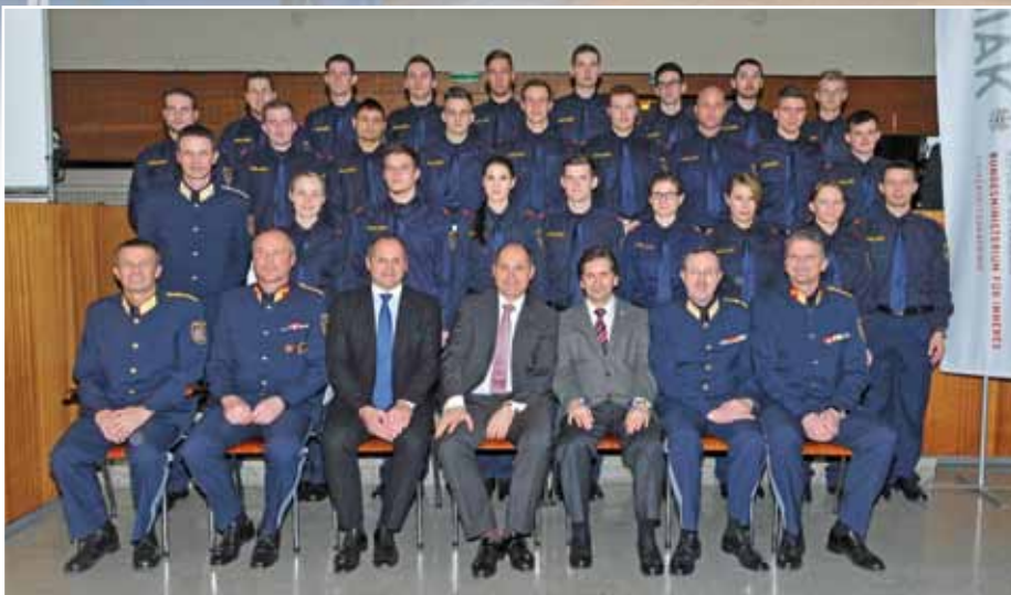
Kollegenschaft des Grundausbildungslehrganges N-PGA 1-12