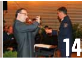
Frühlingskonzert der Polizeimusik NÖ