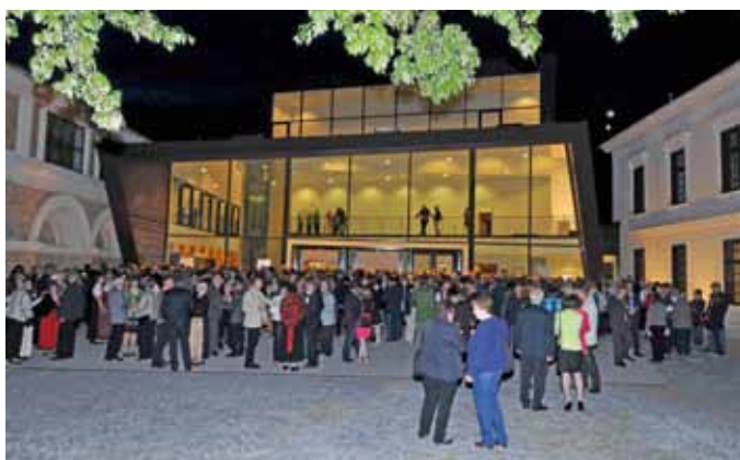
In der Pause