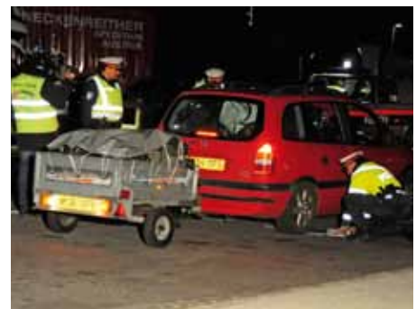
Gewichtskontrolle bei einem schwer beladenen ausländischen PKW

Österreich“ und „NÖ Heute“ zu sehen. Oberst Gottfried Macher hob die ausgezeichnete Zusammenarbeit aller Kräfte hervor und bedankt sich auf diesem Wege bei allen eingesetzten Beamtinnen und Beamten für ihr Engagement.