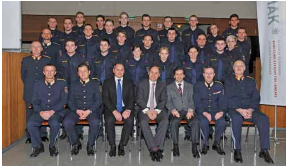
Kollegenschaft des Grundausbildungslehrganges N-PGA 3-12

Des Weiteren fand ebenso am 25. Februar 2014 ein Tag der offenen Tür im Bildungszentrum der Sicherheits-exekutive Niederösterreich in Ybbs an der Donau statt, der von vielen Interessierten besucht wurde.