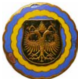
Polizei Krems ab 1948, Ø 50 mm