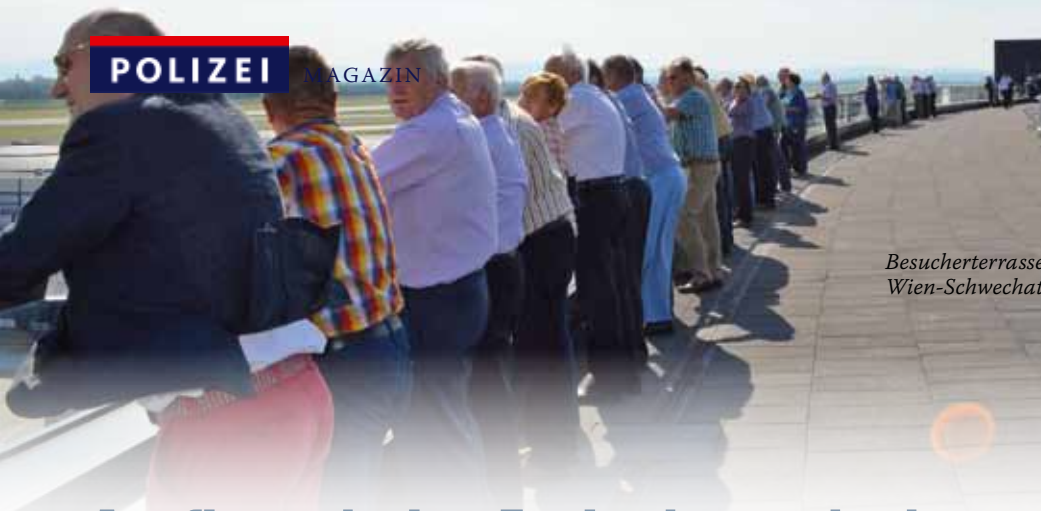
Besucherterrasse am Flughafen Wien-Schwechat