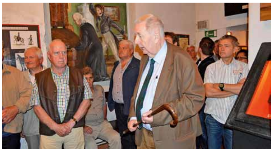
Besuch im Wiener Kriminalmuseum