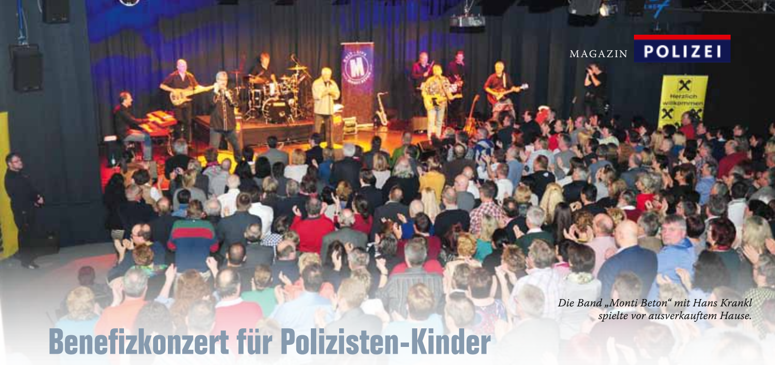
Die Band „Monti Beton“ mit Hans Krankl spielte vor ausverkauftem Hause.