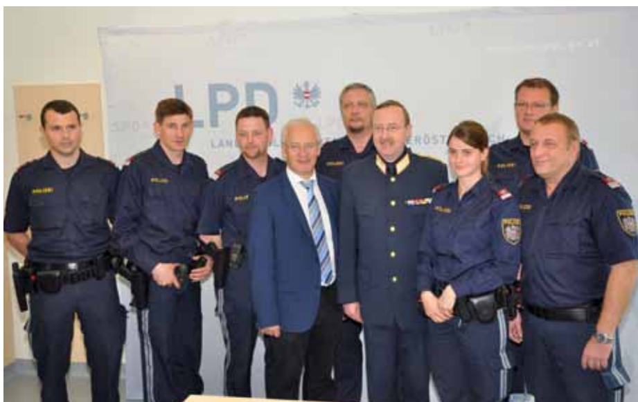
Bedienstete der Polizeiinspektionen Gablitz, Pressbaum und Purkersdorf