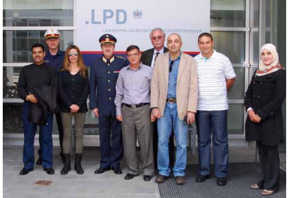
Delegation vom 2. April 2014

Die Angehörigen der Delegationen, welche für die gesamte Verkehrspolizei im Heimatland zuständig sind, wurden der Aufbau, die Struktur und die Aufgabenverteilung in der Landesverkehrsabteilung erörtert sowie in der Praxis gezeigt, was die