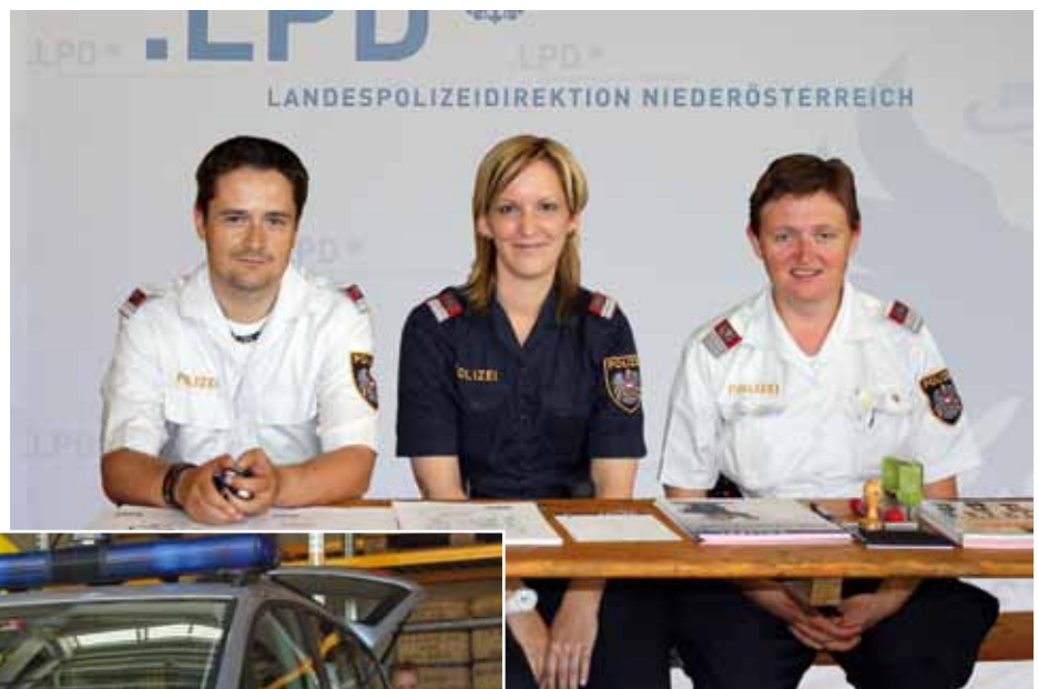
1. Bild oben: Stand der Kinderpolizei