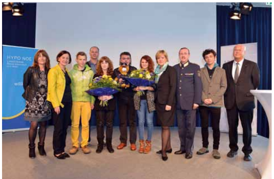
Gruppenbild mit Filmteam und Darstellern