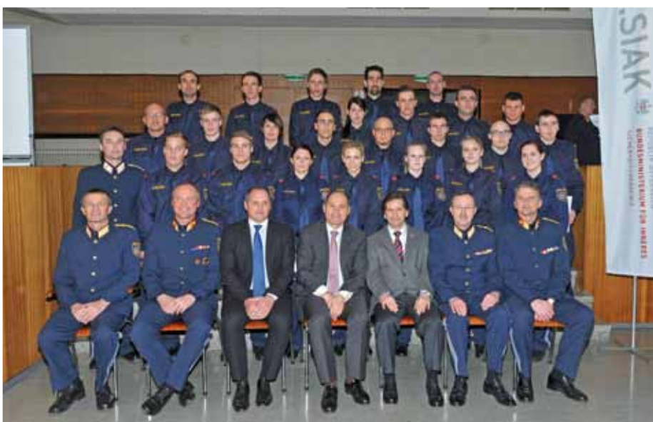
Kollegenschaft des Grundausbildungslehrganges N-PGA 2-12