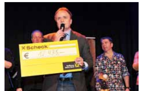
Durch weitere Spenden beim Buffet am Ende der Veranstaltung konnte das Gesamtspendenergebnis von € 12.435,- auf über € 15.000,- aufgestockt werden.