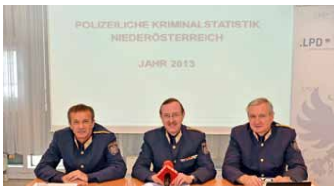
Die Geschäftsführung der LPD NÖ gibt eine Pressekonferenz zur Kriminalstatistik 2013