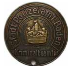
Stadt-Polizeiamt-Baden Kriminalbeamter ab 1975, Ø 50 mm